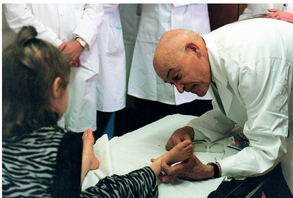
Rycina 2. Profesor Otto Braun-Falco podczas zebrania klinicznego (Freiburg, 2000 r.)

medalami, posiadacz czterech doktoratów honorowych, członek honorowy towarzystw dermatologicznych, autor ok. 700 publikacji naukowych, redaktor i wydawca „Archives of Dermatological Research” oraz „Der Hautarzt” prywatnie był niezwykle miłym i sympatycznym człowiekiem, który z uwagą śledził losy swoich stypendystów (ryc. 3–9, tab. 2). Do ostat-